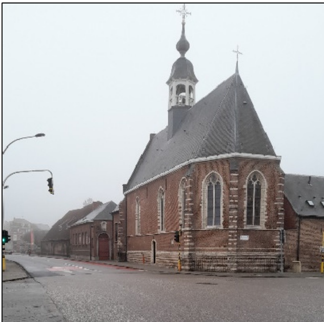
De kloosterkapel van de Augustinessen