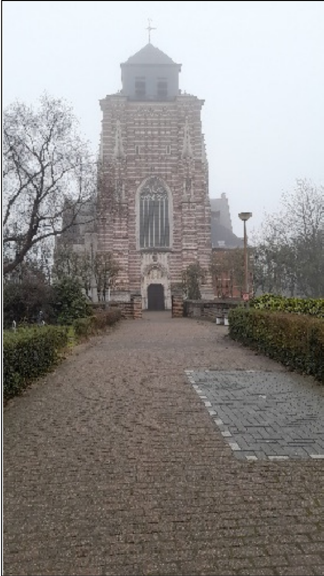
De Sint Dimpna kerk

Op zondag 1 juni gaat het uurwerkgezelschap op daguitstap naar Geel. Deze stad is vanouds wereldberoemd vanwege haar gezinsverpleging van psychiatrische patiënten.