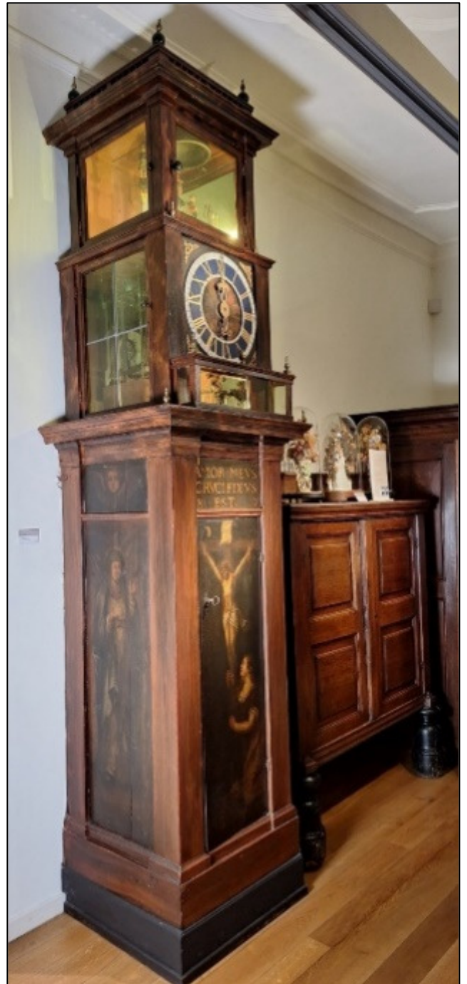
De klok van Corsendonck

Volgens de legende werd Dimpna van Geel door haar vader vermoord in een vlaag van krankzinnigheid. Op haar graf in Geel deden zich naar verluidt genezingen voor en dat bracht pelgrims, vooral geesteszieken, naar Geel. Zij werden ondergebracht in de ziekenkamer die tegen de Sint-Dimpnakerk aan werd gebouwd. Vanaf de 18 de eeuw werden de patiënten in toenemende mate rechtstreeks bij gezinnen ondergebracht. Aan de door Geel kenmerkende gezinsverpleging heeft Geel haar bijnaam 'De barmhartige Stede' te danken.